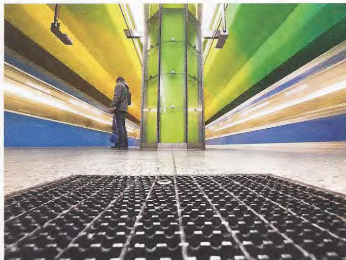
U-Bahnhof „Candidplatz“, Stadtteil Untergiesing: Kamera unmittelbar auf dem Boden mit 7 mm (KB 14 mm) Weitwinklereinstellung. Längere Verschlusszeit mit 0,3 s. Leichte Unterbelichtung von Blende 1/3, damit das Bild nicht zu hell wird.