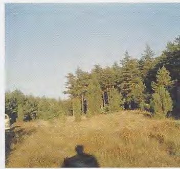
Titel: Schatten.