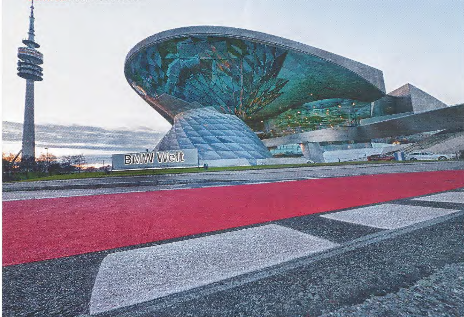
„BMW Welt“ mit dem Münchner Fernsehturm am Rande der Olympia-Anlagen von 1972. Die Kamera direkt auf dem Straßenasphalt mit dem Rücken zum Autoverkehr. Im Vor-